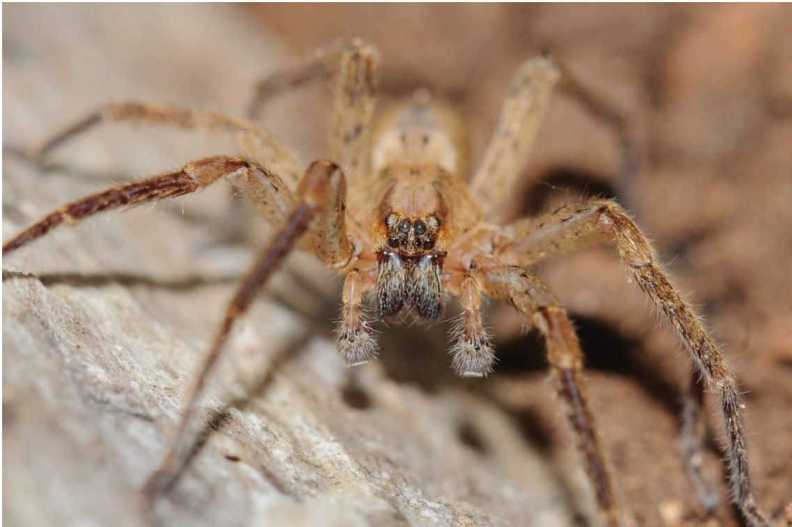
Macho adulto de Zoropsis bilineata Dahl, 1901