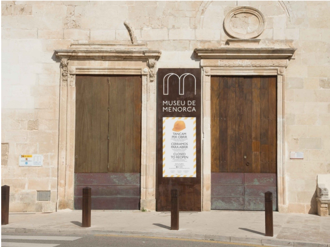
El Museo de Menorca es el lugar donde se va a llevar a cabo las XX Jornadas Ibéricas de Aracnología.

Museo de Menorca: Pla des Monestir, 07701 Maó (Menorca)