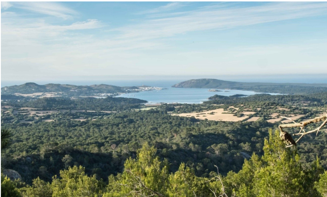
Imagen de la bahía de Fornells, situada en el litoral norte de la isla

Este año, además, se va a repetir una exitosa experiencia, un curso práctico de Aracnología, con el que se quiere ampliar el grupo de personas interesadas en estos artrópodos de ocho patas y facilitar la iniciación o perfeccionamiento del estudio de la Clase Arachnida.